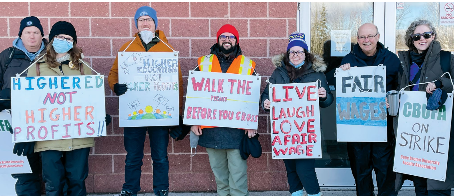
Members of CBUFA head out to their first day on the picket line / Les membres de la CBUFA se préparent à leur première journée sur le piquet de grève